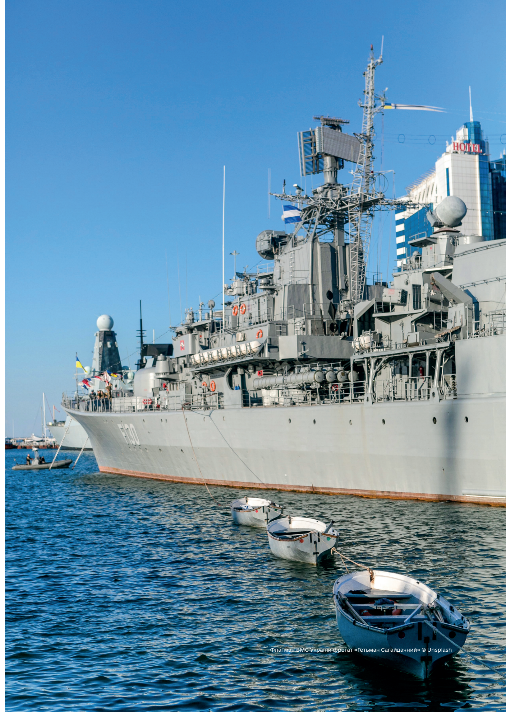
Флагман ВМС України фрегат «Гетьман Сагайдачний»

пейський Союз), BeiDou (Китай), QZSS (Японія) та NavIC (Індія). Російська Федерація є піонером у використанні методів створення хибних сигналів для навігації та використовує це для досягнення своїх стратегічних інтересів. У відповідь на переваги НАТО в можливостях радіоелектронних систем управління Росія визначила пріоритет розробки всеосяжного набору асиметричних систем РЕБ, призначених для обману військових і цивільних приймачів GNSS. Ці системи зараз використовуються в Західному та Південному військових округах Росії на кордоні з НАТО (зокрема Чорному та Балтійському морях) і були розгорнуті на окупованих територіях України та в Сирії. C4ADS двічі виявляла діяльність GNSS-спуфінгу поблизу Керченського мосту – 15 вересня 2016 року та 15 травня 2018 року під час візитів Путіна до цього району. 101 Вже зараз зрозуміло, що така діяльність має бути врегульована, особливо це стосується пасажирських і вантажних перевезень, для яких виникає дуже серйозна небезпека аварій і катастроф.