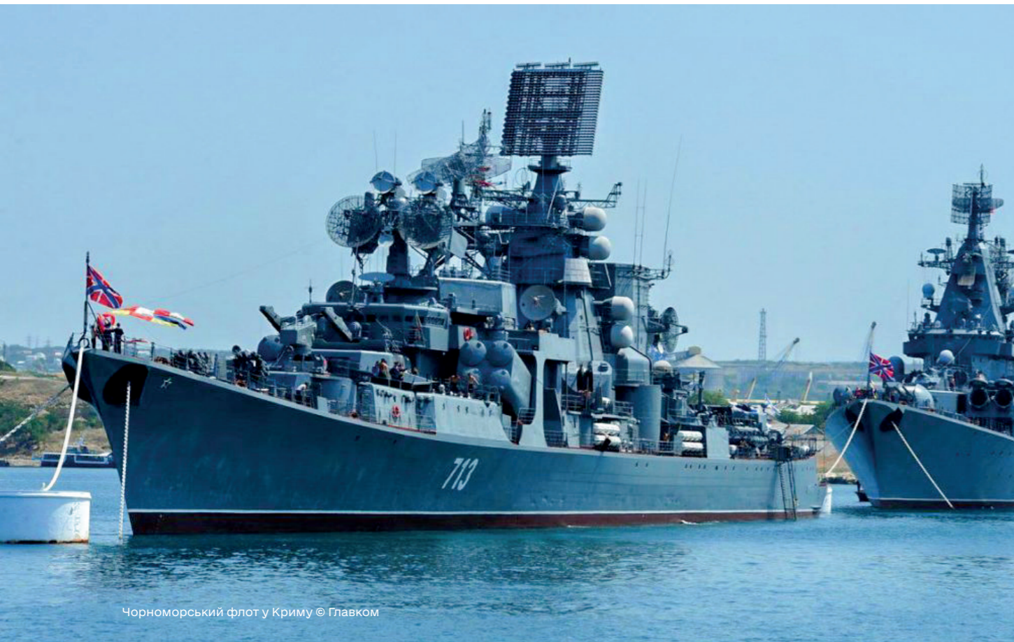
Чорноморський флот у Криму

Крім того, варто згадати і про інформаційно-пропагандистську роботу РФ, спрямо-