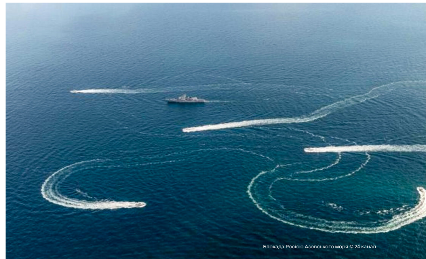
Блокада Росією Азовського моря

Ось, наприклад, дані Міністерства з питань тимчасово окупованих територій, згідно з якими, лише за дві доби 25-27 листопада 2018 року кількість суден у Керченській протоці та поблизу неї збільшилась у більш ніж 2,5 рази – зі 167 до 421-го. Через блокування та перегородження Російською Федерацією проходу Керченською протокою, яка відповідно до Конвенції ООН з морського права 1982 року використовується для міжнародного судноплавства, українські та іноземні торгові судна вимушені залишатися в акваторії Чорного та Азовського морів без подальшої можливості заходження до портів Бердянська та Маріуполя. 63