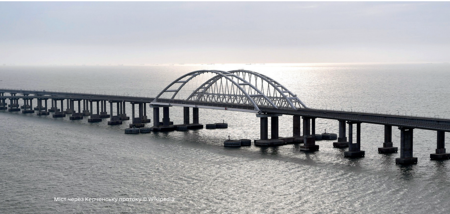
Міст через Керченську протоку.

менті говориться, що будівництво цього об'єкта тягне за собою обмеження свободи мореплавання в Чорному і Азовському морях, відчутне зниження товарообігу та збитки українських азовських портів у Маріуполі й Бердянську, а також нові соціально-економічні ризики стагнації українського Приазов'я. 55