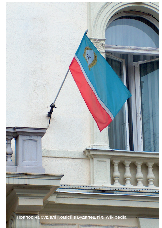
Прапор на будівлі Комісії в Будапешті

Отже, за таких умов участь у Дунайській комісії Російської Федерації, що не є Придунайською державою, становить безпекові ризики як з точки зору можливої наявності військових кораблів РФ на Дунаї, так і блокування розвитку співпраці Придунайських держав, а також здійснення співпраці країн НАТО та України по забезпеченню регіональної безпеки.