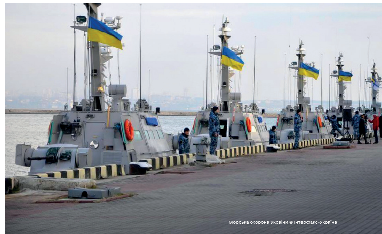
Морська охорона України

Першим методом цієї роботи є декларування Росією необґрунтовано великих за розміром і тривалістю районів моря забороненими для судноплавства, нібито для бойової підготовки та проведення стрільб. Формально тимчасове закриття морських ділянок за певними причинами