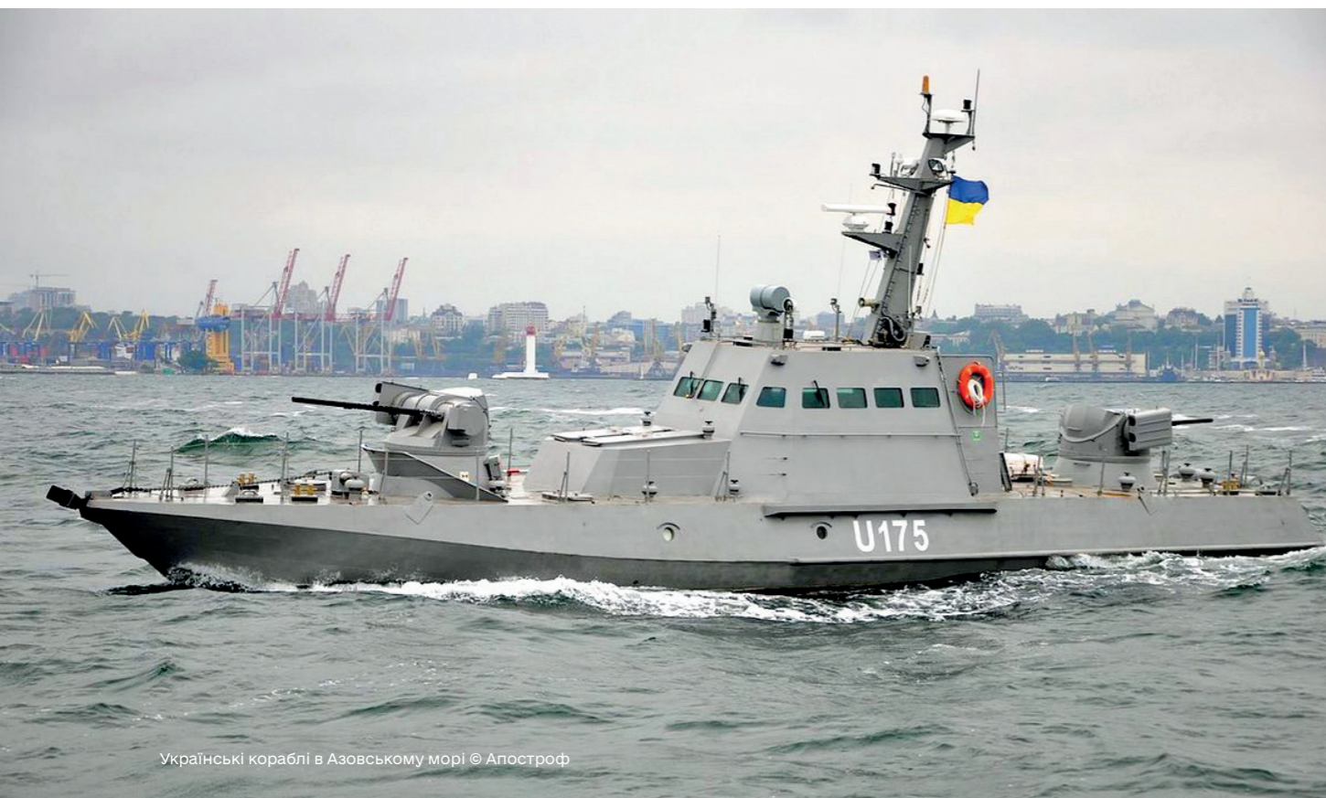
Українські кораблі в Азовському морі

У відповідності до статті 3 Договору Українсько-російське співробітництво, зокре-