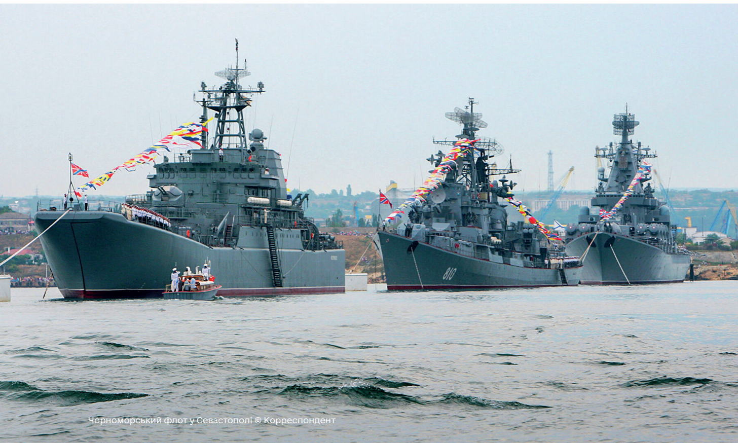
Чорноморський флот у Севастополі

РРФСР 1938 року, як і 1978 року, в період між сесіями Верховної Ради питання, віднесені до її відання, вирішувала Президія Верховної Ради. Тому позиція депутатів Верховної Ради РФ щодо того, що, мовляв, тодішня Президія не могла вирішувати питання про передачу Криму – необґрунтована. І тут же автор слушно зазначає, що за такою ж логікою можна було б визнати нікчемними постанови щодо включення Туви до складу РРФСР у 1944 році або щодо перетворення 16-ої союзної республіки, Карело-Фінської, на російську автономію.